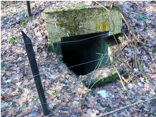
Bild des ursprünglichen Zugangs aus dem Jahr 2008.

Rechtzeitig zum Jahresabschluss konnten die Arbeiten an unserem neu erworbenen 12 Mann-Unterstand in der Limmatstellung abgeschlossen werden (siehe dazu auch der Beitrag aus den letzten Neuigkeiten).